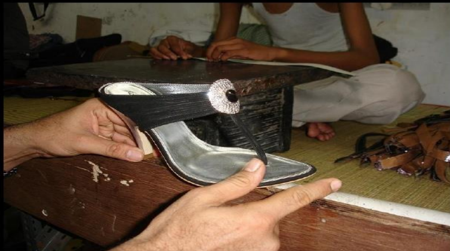
PRODUCTO ACABADO CON UN COSTO INFERIOR A 5,00 DOLARES