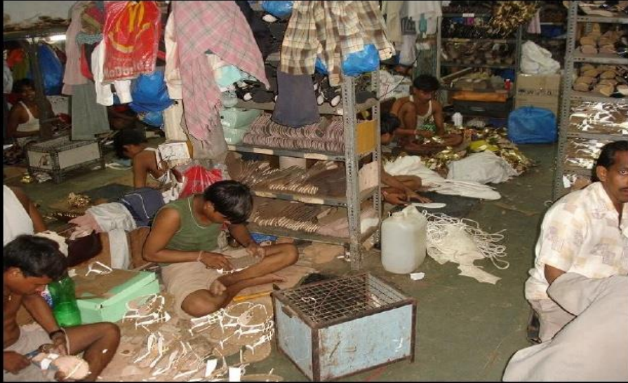
MUCHOS NIÑOS TRABAJANDO