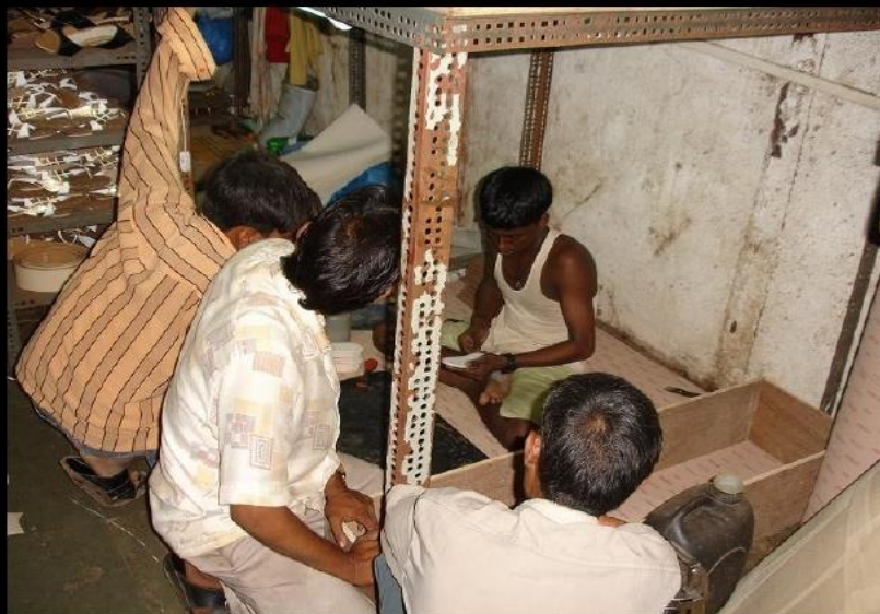
LUGAR DE ELABORACION DEL PRODUCTO