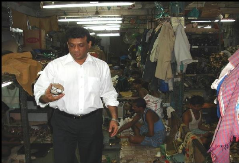
DUEÑO DE LA FABRICA Y DE LOS NEGOCIOS